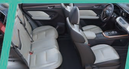
Черно и сиво