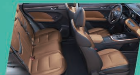
Черно и кафяво