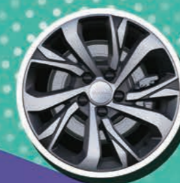
17" алуминиеви джанти