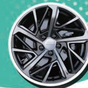
18" алуминиеви джанти