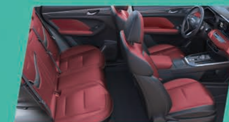
Черно и червено