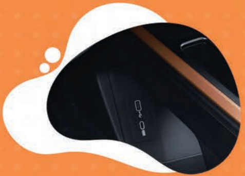
USB ТИП А & С НА ПЪРВИ РЕД

РАЗНООБРАЗИЕ ОТ МЕСТА ЗА СЪХРАНЕНИЕ НА ВАШИТЕ ВЕЩИ