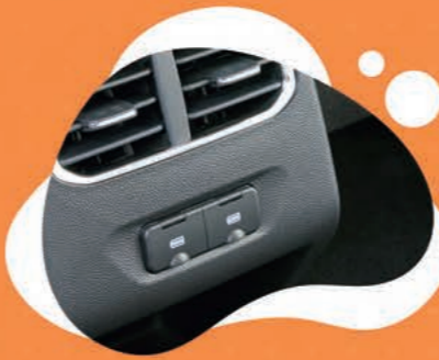
USB ЗА ВТОРИ РЕД СЕДАЛКИ