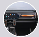
ЧЕРНО С ОРАНЖЕВО