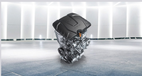
Двигател 1.5 T