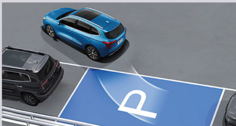
Автоматичен паркинг асистент